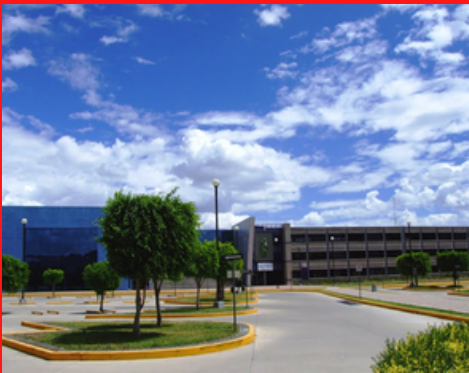
CAMPUS JUAN ALONSO DE TORRES