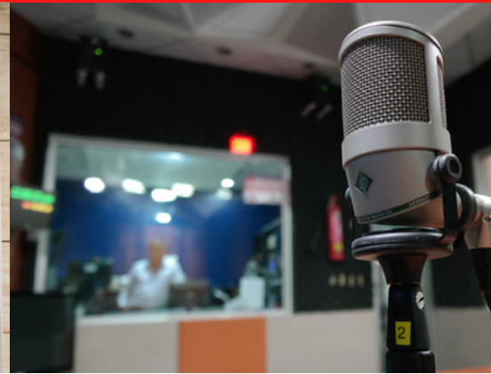
Arquitectura, Diseño y Comunicación