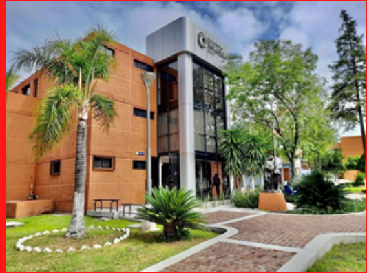
CAMPUS SAN FRANCISCO DEL RINCÓN