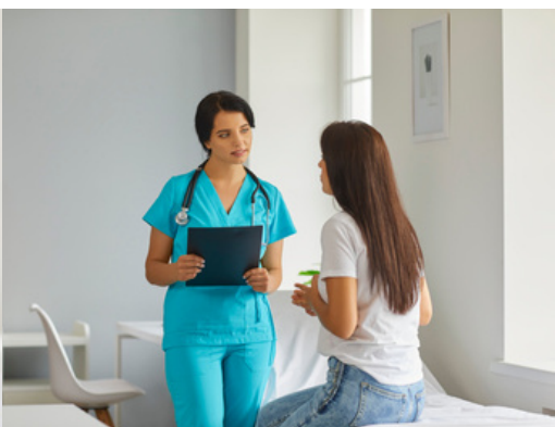
Odontología, Medicina y Enfermería