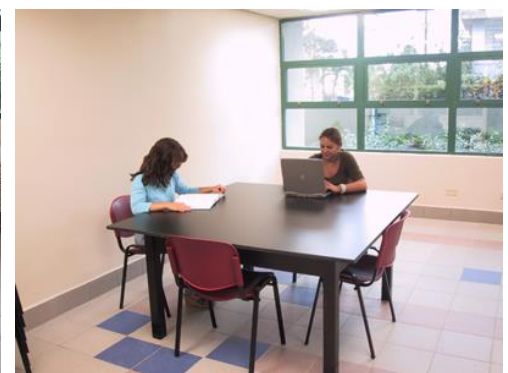
Sala de estudio grupal