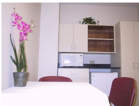
Mesa comedor y cocinilla