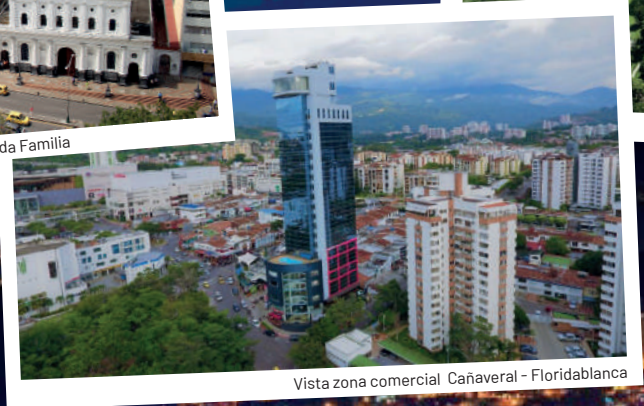
Vista zona comercial Cañaveral - Florida Blanca