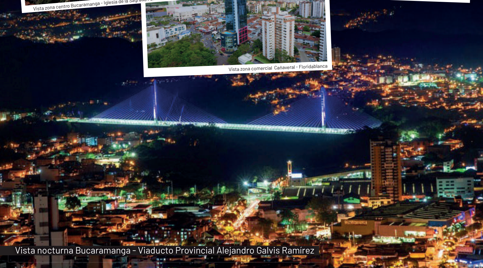
Vista nocturna Bucaramanga - Viaducto Provincial Alejandro Galvis Ramírez