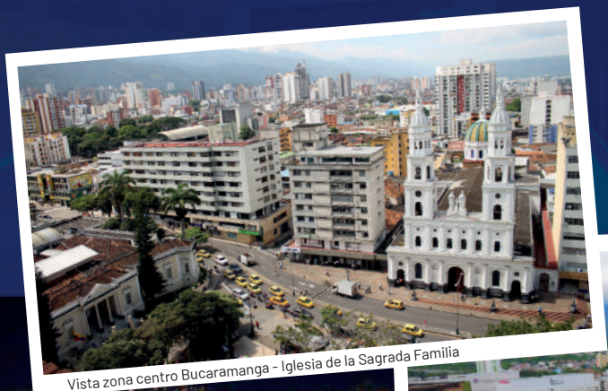
Vista zona centro Bucaramanga - Iglesia de la Sagrada Familia

Conocida como la Ciudad Bonita, Bucaramanga se encuentra en el corazón de Santander. Es una tierra de encanto, rodeada de montañas que se pueden ver desde cualquier punto de la ciudad. En cuanto a su clima, su rango de temperaturas va desde los 20 hasta los 28 grados centígrados y se puede disfrutar desde un día fresco y lluvioso para estar en casa hasta un sol radiante perfecto para actividades al aire libre como deportes extremos y visitar los pueblos encantadores que tiene Santander.