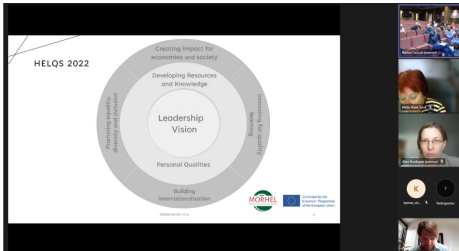
Imagen 5: Captura de pantalla de la programación de visitas a Universidades europeas implicadas en el proyecto.